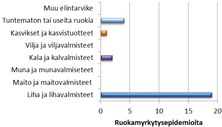
Kuva: Ruokamyrkytysepidemiarekisteriin (RYMY) ilmoitetut talousvesivälitteisten Clostridium perfringens -epidemioitten välittäjäelintarvikkeet vuodesta 2000.