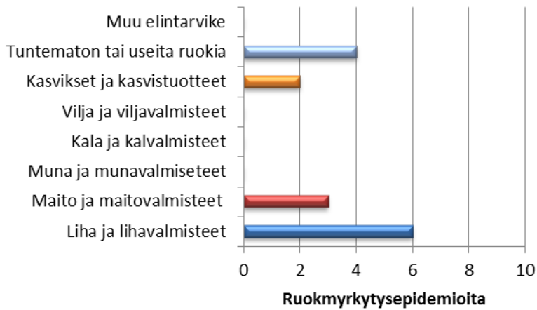
Kuva: Ruokamyrkytys-epidemiarekisteriin (RYMY) ilmoitetut talousvesivälitteisten kampylobakteeri epidemioitten välittäjäelintarvikkeet 2000-luvulla.