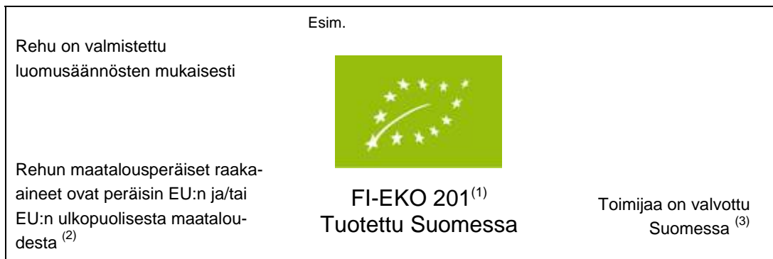
Kuva 2: Yhteisön tunnuksen, lehtilogon käyttö tuotantoeläinten rehuissa

(3) Lisäksi voidaan täydentää maan nimi, jos kaikki tuotteeseen sisältyvät raaka-aineet on tuotettu ko. maassa. Vähäiset